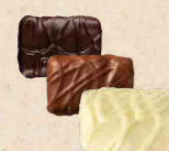
CASALEO Praliné au riz soufflé