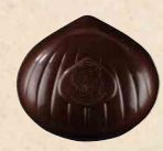
MARRON NOISETTE NOIR Praliné saveur café aux noisettes caramélisées