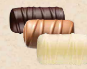
BÛCHE PRALINÉ Praliné tendre