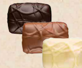
NOISETTE MASQUÉE Praliné avec une noisette entière