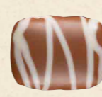
MOSAÏQUE FEUILLETINE Praliné croquant aux brisures de feuilletine