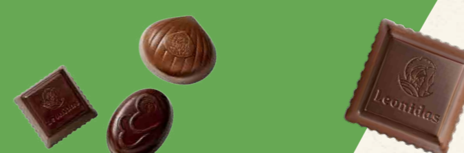
Cône de chocolats 300g