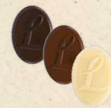
LOUISE Praliné saveur caramel, Praliné saveur caramel aux noisettes caramélisées