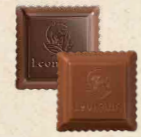
CARRÉ CROQUANT Praliné au riz soufflé