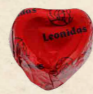
FOREVER ROUGE Chocolat au lait, praliné