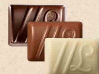
DUETTO Ganache au chocolat noir à la fraise et vinaigre balsamique ou au chocolat au lait, crème de nougat et graines de sésame ou au chocolat noir yuzu et saveur fruit du dragon

Ces chocolats ne représentent qu'une partie de notre offre.