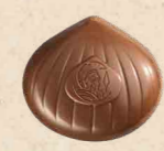
MARRON CAFÉ LAIT Praliné saveur café