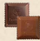
CARRÉ CROQUANT Praliné au riz soufflé