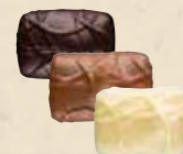
NOISETTE MASQUÉE Praliné avec une noisette entière