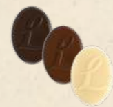
LOUISE Praliné saveur caramel, Praliné saveur caramel aux noisettes caramélisées