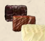
CASALEO Praliné au riz soufflé