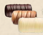
BÛCHE PRALINÉ Praliné tendre