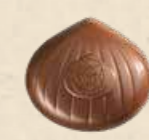
MARRON CAFÉ LAIT Praliné saveur café