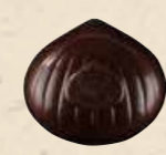
MARRON NOISETTE NOIR Praliné saveur café aux noisettes caramélisées