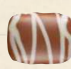
MOSAÏQUE FEUILLETINE Praliné croquant aux brisures de feuilletine