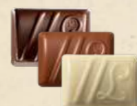
DUETTO Ganache au chocolat noir à la fraise et vinaigre balsamique ou au chocolat au lait, crème de nougat et graines de sésame ou au chocolat noir yuzu et saveur fruit du dragon

Ces chocolats ne représentent qu'une partie de notre offre.