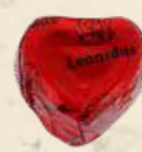
FOREVER ROUGE Chocolat au lait, praliné